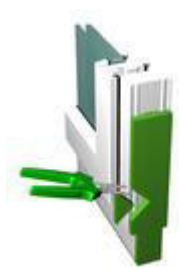
Bild 1: Abdichtung aussparen

Pulverbeschichtungs- und Lackierprozesse: SP351 kann nach dem vollständigen Aushärten kurzfristig erhöhten Temperaturen ausgesetzt werden und eignet sich somit zum Pulverbeschichten. Nachfolgende Einbrennprozesse sind ohne Veränderung der mechanischen Eigenschaften des Klebers möglich: +180°C über einen Zeitraum von max. 30 Minuten, +200°C über einen Zeitraum von max. 10 Minuten.