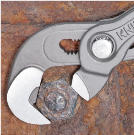
Arbeiten an verrosteter Mutter mit verrundeten Kanten

Selbstklemmend: kein Abrutschen am Werkstück, weniger Kraftaufwand